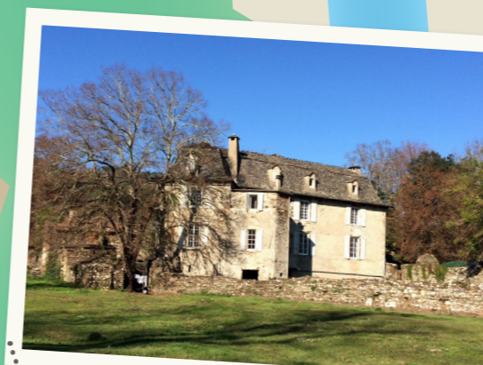
LE MANOIR DES CAMBOUS

proposera de remplir des missions pour vous rapprocher de votre merveilleux objectif !